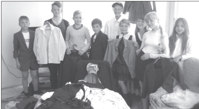
Из рук в руки: эти вещи ещё послужат.

Отделение профилактической работы с семьей и детьми организовало социально направленное мероприятие в рамках благотворительной акции «Семья помогает семье: готовимся к школе!», инициированной Департаментом соцзащиты населения области.