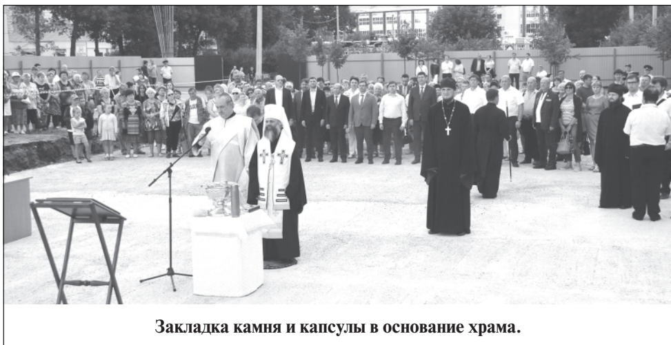
Закладка камня и капсулы в основание храма.

Закладка камня и капсулы в основание храма Всемилостивого Спаса в память о воинах, погибших на фронтах Великой Отечественной войны, состоялась в Иваново. Вместе со священнослужителями и верующими в мероприятии приняли участие временно исполняющий обязанности губернатора Ивановской области Stanisлав Воскресенский, митрополит Иваново-Вознесенский и Вичугский Иосиф, руководство области и города.