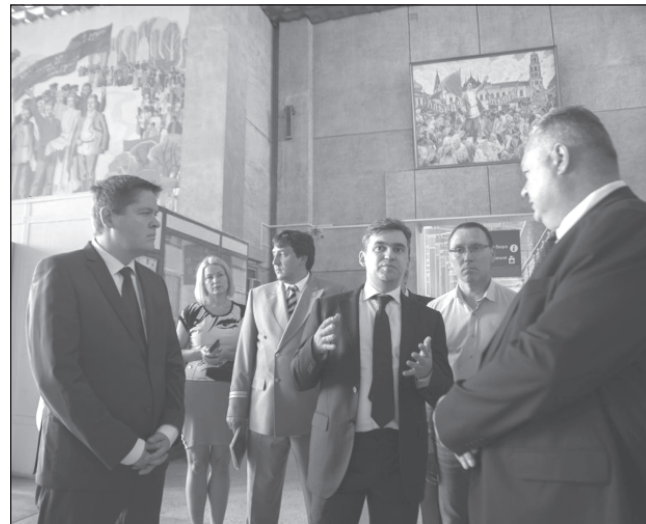
Инспектирование хода строительных работ.

Временно исполняющий обязанности губернатора Ивановской области Stanisлав Воскресенский посетил железнодорожный вокзал в Иваново и проинспектировал ход работ по ремонту фасада здания. Кроме того, компания РЖД представила обновленный состав поезда «Москва-Кинешма», который начнет курсировать уже в сентябре.