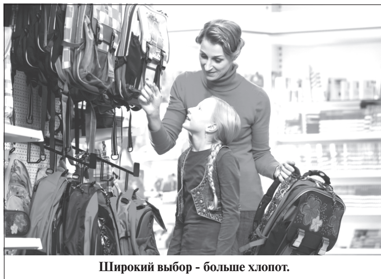
Широкий выбор - больше хлопот.

как сообщили продавцы таких торговых точек, ближе к осени придётся потратить больше.