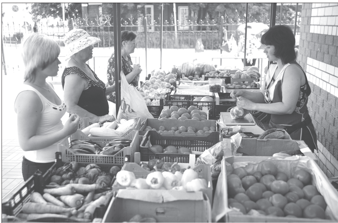
Производители часто выдают импортные фрукты и овощи за отечественные.